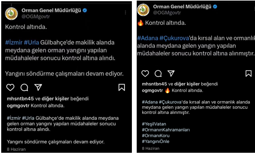
Resim 7. OGM'nin “Kontrol altında.” mesajını ileten sosyal medya paylaşımları

iletişim aracı olarak kullanılmaktadır. Gönderide yer alan bölgesel “hashtag”ler (#Adana, #Çukurova), bilgiye yerel bir bağlam katarak, bölgedeki halkın doğrudan bilgilendirilmesini sağlamaktadır. Bu durum, kriz anlarında doğru bilgi akışını sağlamak ve gereksiz paniği önlemek adına önem taşımaktadır. İkinci gönderide, benzer şekilde İzmir'in Urla bölgesinde meydana gelen yangının da kontrol altına alındığı belirtilmektedir. Yine kısa, öz ve durumun kontrol altında olduğunu belirten bu mesaj, yangınla mücadelede güven vermekte ve kamuoyunu bilgilendirmektedir. Sonuç olarak, bu paylaşımlar, kriz iletişiminin önemli bir yönü olan hızlı ve doğru bilgilendirme yaparak, halkın güvenini kazanmayı ve onları bilgilendirmeyi amaçlayan etkili bir stratejiyi göstermektedir. Kısa ve net ifadeler, yerel bağlamda kullanılan hashtagler ve durumun kontrol altında olduğunu belirten mesajlar, kriz anlarında kamuoyunu sakinleştirmekte ve doğru bilgilendirmeyi sağlamaktadır.