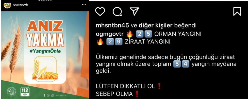
Resim 8. “Anız Yakma” Sloganlı sosyal medya gönderisi tasarımı

Resim 9’da bulunan başlıklı gönderi kriz iletişimi açısından incelediğimizde, Orman Genel Müdürlüğü’nün yangın riski konusunda toplumda farkındalık yaratmak ve acil bir durum karşısında harekete geçilmesini teşvik etmek amacıyla bilgilendirici ve uyarıcı mesajlar içeren bir görsel iletişim stratejisi kullandığı görülmektedir. Görselde kullanılan “Dikkat” başlığı ve termometre simgesi, mesajın aciliyetini ve ciddiyetini vurgulamaktadır. Arka plandaki orman yangını görseli, tehdidin somut ve yakıcı olduğunu hissettirmektedir. Özellikle renk seçimi (kırmızı ve sarı tonlar), tehlike ve uyarı anlamını güçlendirmektedir. Mesaj, izleyiciyi yüksek sıcaklık ve düşük nemin orman yangını riskini artırdığı konusunda bilgilendirmekte ve bu tür durumlar için alınması gereken önlemleri vurgulamaktadır. Metinde kullanılan kelimeler ve simgeler (“Lütfen Dikkat” ve alev emojisi), mesajın aciliyetini pekiştirmektedir. Ayrıca, 112 Acil Çağrı numarasının vurgulanması, acil bir durumda atılacak ilk adımı netleştirmektedir. Bu strateji, halkın yangın riski konusunda daha bilinçli olmasını sağlamak ve acil durumlarda hızlı bir şekilde doğru adımları atmaları için yönlendirmektedir. Bu tür paylaşımlar, kriz iletişimi açısından toplumda gerekli duyarlılığı artırmakta ve olası yangın risklerinin en aza indirilmesine katkıda bulunmaktadır.