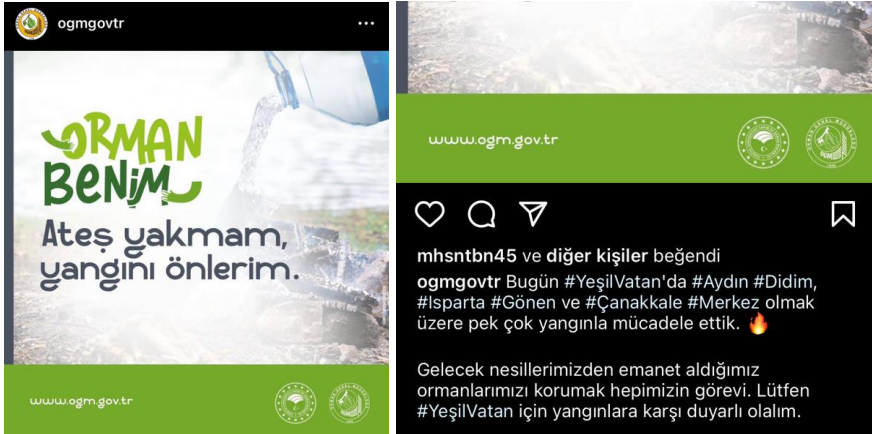
Resim 11. Orman Benim başlıklı gönderi tasarımı