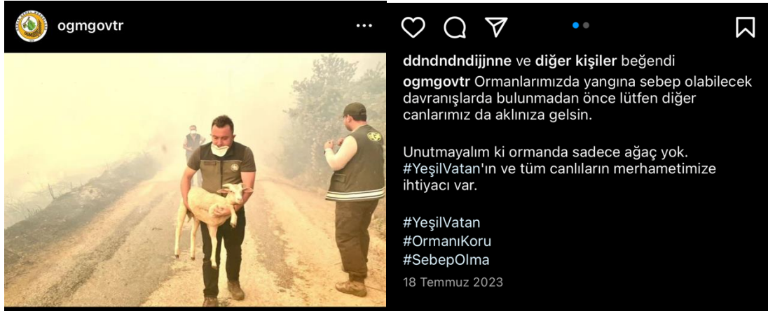
Resim 3. Yangından zarar görmüş bir hayvanı kurtarıırken fotoğraflanan bir OGM personeli

Resim 4'te bulunan gönderi, Orman Genel Müdürlüğü'nün devam eden orman yangınları ile mücadele sürecine dair bir güncellemeyi göstermektedir. "Son Durum" başlığı altında