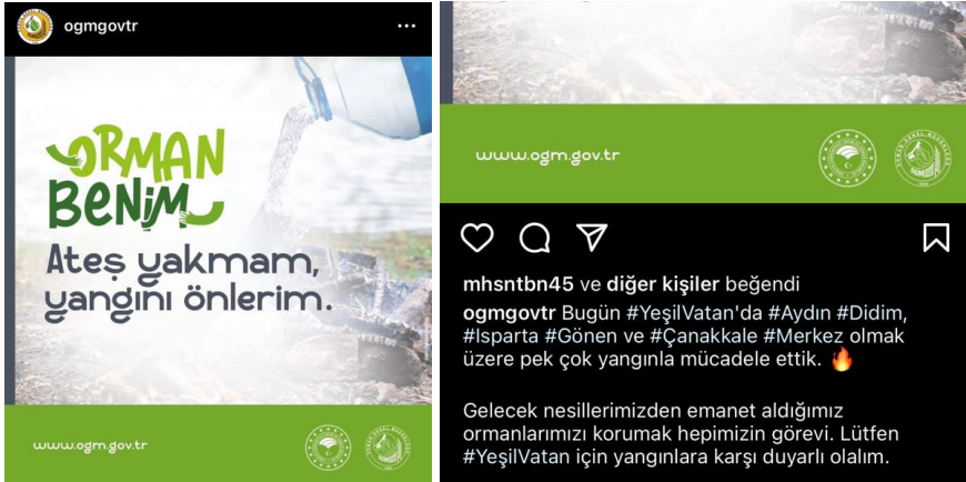
Resim 11. Orman Benim başlıklı gönderi tasarımı