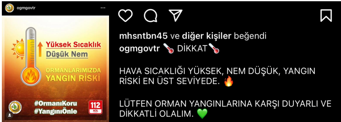
Resim 6. OGM'nin Ormanlarımızda Yangın Riski başlıklı gönderi tasarımı

Resim 7'de bulunan gönderilerde kısa ve net bir mesaj ile “Kontrol altında” ifadesi vurgulanmaktadır. Bu gönderiler, kriz iletişimi açısından analiz edildiğinde, Orman Genel Müdürlüğü'nün orman yangınlarına yönelik acil durum bilgilerini kamuoyuna duyurma ve durumu kontrol altında tutma çabalarını yansıtmaktadır. Bu, yangının başarılı bir şekilde kontrol altına alındığını gösteren kısa ve öz bir bilgilendirme mesajıdır. Böyle bir mesaj, halkın endişelerini hafifletmek ve durumun kontrol altında olduğunu belirtmek için stratejik bir