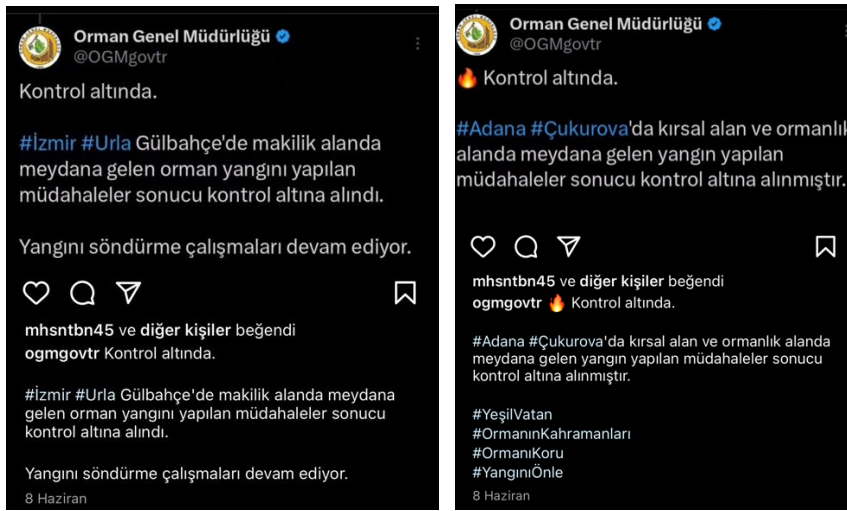
Resim 7. OGM'nin “Kontrol altında.” mesajını ileten sosyal medya paylaşımları

iletişim aracı olarak kullanılmaktadır. Gönderide yer alan bölgesel “hashtag”ler (#Adana, #Çukurova), bilgiye yerel bir bağlam katarak, bölgedeki halkın doğrudan bilgilendirilmesini sağlamaktadır. Bu durum, kriz anlarında doğru bilgi akışını sağlamak ve gereksiz paniği önlemek adına önem taşımaktadır. İkinci gönderide, benzer şekilde İzmir'in Urla bölgesinde meydana gelen yangının da kontrol altına alındığı belirtilmektedir. Yine kısa, öz ve durumun kontrol altında olduğunu belirten bu mesaj, yangınla mücadelede güven vermekte ve kamuoyunu bilgilendirmektedir. Sonuç olarak, bu paylaşımlar, kriz iletişiminin önemli bir yönü olan hızlı ve doğru bilgilendirme yaparak, halkın güvenini kazanmayı ve onları bilgilendirmeyi amaçlayan etkili bir stratejiyi göstermektedir. Kısa ve net ifadeler, yerel bağlamda kullanılan hashtagler ve durumun kontrol altında olduğunu belirten mesajlar, kriz anlarında kamuoyunu sakinleştirmekte ve doğru bilgilendirmeyi sağlamaktadır.