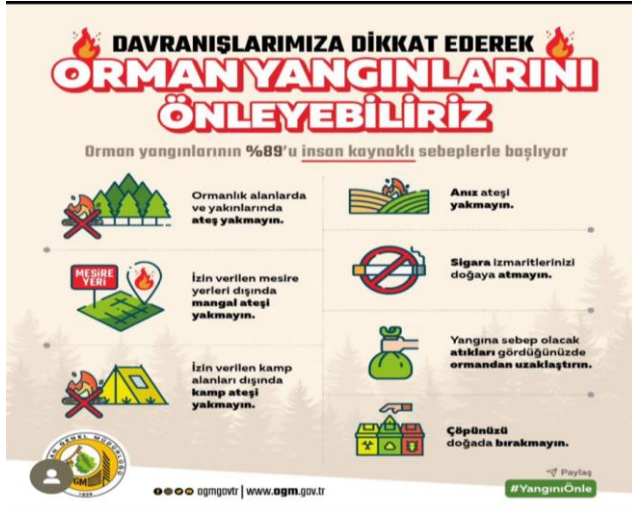
Resim 2. OGM'nin orman yangınlarını önleme konusunda yapılabilecekleri içeren infografik tasarımı

Resim 3'te, bir Orman Genel Müdürlüğü personeli, orman yangını sırasında bir koyunu kurtarıırken görüntülenmiş bulunmaktadır. Bu görsel, orman yangınlarının yalnızca bitki örtüsüne değil, aynı zamanda hayvanlara da ciddi zarar verdiğini çarpıcı bir şekilde ortaya koymaktadır. Fotoğraf, izleyicide empati uyandırarak yangınların geniş kapsamlı etkilerine dikkat çekmekte ve insanları yangınları önlemeye yönelik daha duyarlı hale getirmeyi amaçlamaktadır. Ayrıca, metinde yangınlara neden olabilecek davranışlardan kaçınmanın önemi vurgulanmakta ve ormanların sadece ağaçlardan ibaret olmadığı, içinde birçok canlının yaşadığı belirtilmektedir. Görselin duygusal etkisi, toplumun orman yangınlarına karşı daha bilinçli olmasına katkı sağlamaktadır. Orman Genel Müdürlüğü'nün bu yaklaşımı, orman yangınlarıyla mücadelede farkındalık yaratmayı ve toplumun aktif katılımını teşvik etmeyi amaçlayan etkili bir kriz iletişimi stratejisi olarak değerlendirilmektedir.