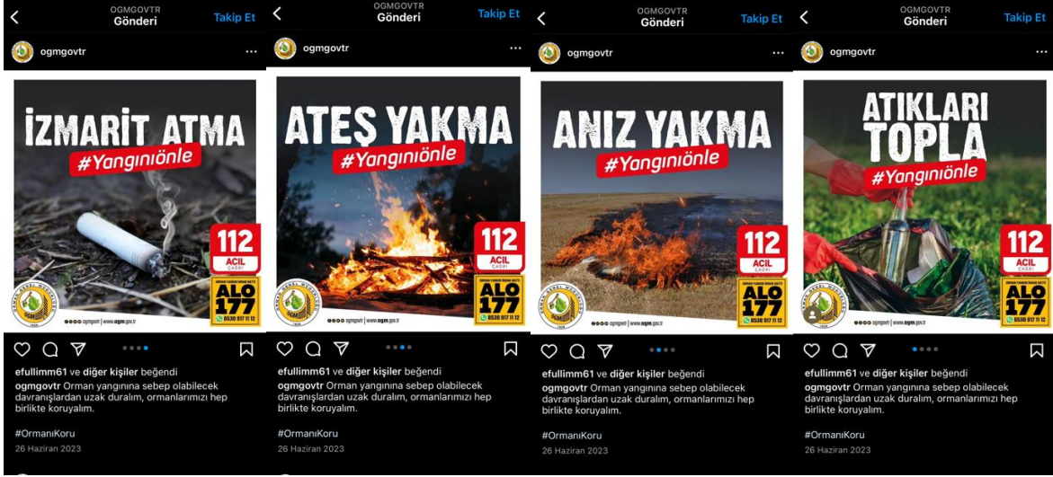
Resim 1. OGM'nin "Yangını önle" sloganlı sosyal medya paylaşımları

stratejik adımlar olarak değerlendirilebilir. Görsellerin amacı, halkı bilinçlendirerek orman yangınlarını önlemeye katkıda bulunmaktır.