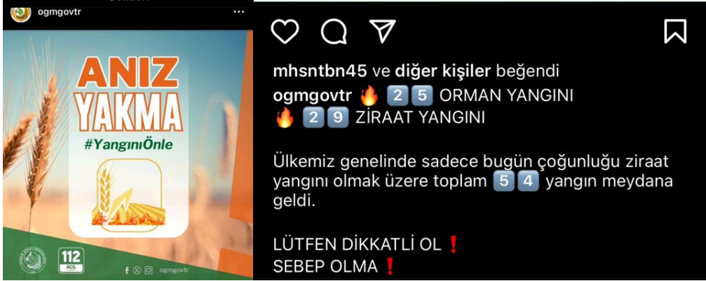
Resim 8. “Anız Yakma” Sloganlı sosyal medya gönderisi tasarımı

Resim 9’da bulunan başlıklı gönderi kriz iletişimi açısından incelediğimizde, Orman Genel Müdürlüğü’nün yangın riski konusunda toplumda farkındalık yaratmak ve acil bir durum karşısında harekete geçilmesini teşvik etmek amacıyla bilgilendirici ve uyarıcı mesajlar içeren bir görsel iletişim stratejisi kullandığı görülmektedir. Görselde kullanılan “Dikkat” başlığı ve termometre simgesi, mesajın aciliyetini ve ciddiyetini vurgulamaktadır. Arka plandaki orman yangını görseli, tehdidin somut ve yakıcı olduğunu hissettirmektedir. Özellikle renk seçimi (kırmızı ve sarı tonlar), tehlike ve uyarı anlamını güçlendirmektedir. Mesaj, izleyiciyi yüksek sıcaklık ve düşük nemin orman yangını riskini artırdığı konusunda bilgilendirmekte ve bu tür durumlar için alınması gereken önlemleri vurgulamaktadır. Metinde kullanılan kelimeler ve simgeler (“Lütfen Dikkat” ve alev emojisi), mesajın aciliyetini pekiştirmektedir. Ayrıca, 112 Acil Çağrı numarasının vurgulanması, acil bir durumda atılacak ilk adımı netleştirmektedir. Bu strateji, halkın yangın riski konusunda daha bilinçli olmasını sağlamakta ve acil durumlarda hızlı bir şekilde doğru adımları atmaları için yönlendirmektedir. Bu tür paylaşımlar, kriz iletişimi açısından toplumda gerekli duyarlılığı artırmakta ve olası yangın risklerinin en aza indirilmesine katkıda bulunmaktadır.