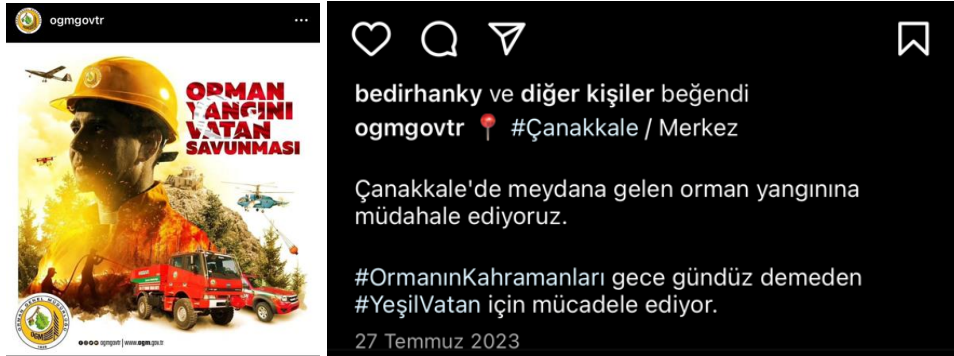
Resim 5. Orman Yangını Vatan Savunması başlıklı gönderi tasarımı

Resim 6'da Orman Genel Müdürlüğü'nün kriz iletişimi açısından dikkat çekici bir strateji uyguladığı görülmektedir. Özellikle yüksek sıcaklık ve düşük nem oranlarının orman yangınlarına neden olabileceği vurgulanarak, termometre simgesi ve sıcak renklerle birlikte görselde uyarıcı bir etki yaratılmaktadır. Tasarımda kullanılan renkler, yangın ve tehlike unsurlarını vurgulamak için kırmızı ve turuncu tonlarıyla desteklenmektedir. “Yüksek Sıcaklık” ve “Düşük Nem” ifadelerinin kırmızı ve gri renklerde vurgulanması, tehlikenin ciddiyetini belirtmektedir. Ayrıca, termometre görseli ile yükselen sıcaklık gösterimi de yangın riskinin yüksekliğini anlatmaktadır. Orman yangınlarının ciddiyeti, turuncu ve kırmızı tonlarının yangınla özdeşleşmiş olması nedeniyle izleyicilere etkili bir şekilde aktarılmaktadır. “Ormanlarımızda Yangın Riski” ifadesi ise, doğrudan ve net bir iletişim sağlayarak mesajın anlaşılabilirliğini artırmaktadır. Kullanılan “hashtag”ler ve “112 Acil Çağrı” ibaresi, acil durumlarda hızlı müdahale için önemli bir hatırlatma görevi görmektedir. Bu bağlamda, görsel hem bilinçlendirme hem de harekete geçirme amacıyla etkili bir şekilde tasarlanmış olup, kriz anında toplumsal duyarlılığı artırmayı hedeflemektedir.