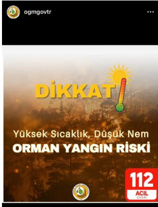
Resim 9. OGM’nin Orman Yangın Riski sloganlı sosyal medya gönderisi

Resim 10’da bulunan infografikler, 23 ve 24 Haziran 2024 tarihleri itibariyle orman yangınlarına ilişkin güncel verileri detaylı bir şekilde sunmaktadır. Bu durum, Orman Genel Müdürlüğü’nün şeffaflık politikası dahilinde halkı bilgilendirme konusunda istekli olduğunu